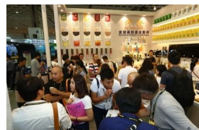
COMPUTEX TAIPEI 2018