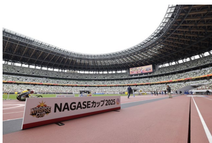
舞台は国立競技場

競技以外では、昨年掲げた「インクルーシブの輪をさらに広げる」というコンセプトを継承しつつ、アスリート・観客双方が参加しやすく、楽しめる取り組みを強化しました。会場内には、昨年に引き続き義足体験やデジタルデバイスを活用した観戦体験の提供に加え、新たに車いすレーサー体験を導入。子どもから大人まで、アスリートが使用する器具に直接触れ、スポーツを通じた多様性やインクルージョンを自らの体で感じられる機会を提供しました。