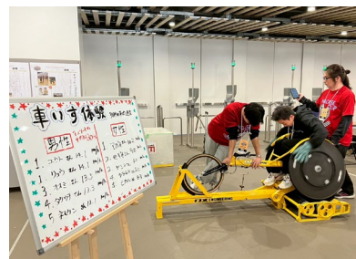
体験エリア・車いすレーサー体験