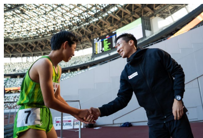
選手と熱い握手を交わす桐生選手（右）