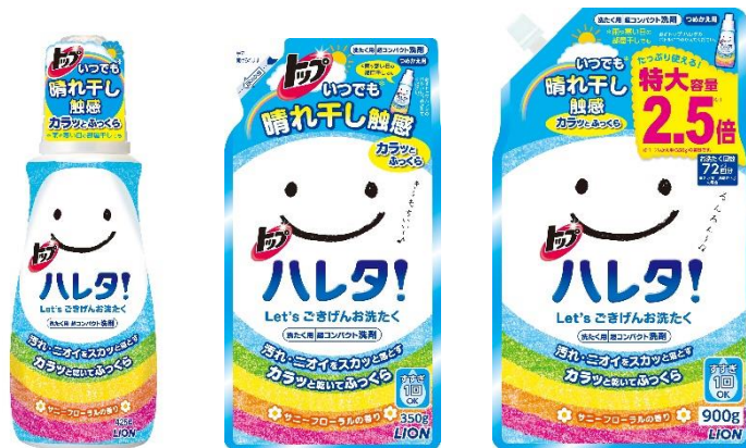
トップ ハレタ（左から、本体 425g／つめかえ用 350g／つめかえ用特大 900g）

晴れた日の「乾き上がり」に着目し、晴れた日はもちろん、雨や寒い日の部屋干しでも、洗濯物がカラッと乾いてふっくら仕上がる超コンパクト衣料用液体洗剤『トップ ハレタ』が、2018年8月に新登場。汚れを落としながら、「カラふわ成分」がセニイを根元からふっくら立ち上げます。タオルを洗濯すると、パイル（毛房）が立ち上がり、晴れた日に屋外で干したタオルのように、「カラッと」乾いている感じや、「ふっくら」厚みがある心地よい肌触りに仕上がります。