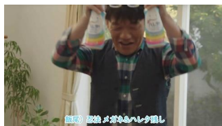
飯尾 忍法メガネハレタ隠し