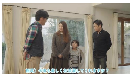
飯尾 今後も楽しくお洗濯してくださいませ？