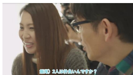
飯尾 2人は仲良いんですか？