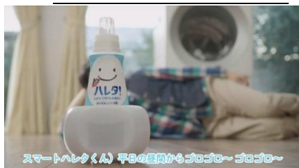
スマートハレタくん 早朝の扉開けもゴロゴロ〜ゴロゴロ〜