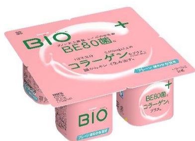
プレーン ほのかな甘さ

ダノンジャパン株式会社(本社:東京都目黒区、代表取締役社長:STEIN・VANDERVOEST)は、“ダノン史上最強レベル※”の高い生存率で生きたまま腸に届くBE80菌の「ダノンビオ」から、新たに肌に嬉しいコラーゲンを配合した「ダノンビオ コラーゲンプラス」3製品を9月28日(月)より、全国のスーパーマーケット向けに出荷を開始いたします。なお、本製品のテレビCMを10月5日(月)より順次放映いたします。※当社比。BE80菌に係る30年の研究において、生きたまま腸に届く確率が最高レベルのビフィズス菌の一つ。