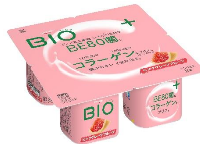
ピンクグレープフルーツ

現在、新しい生活様式へのシフトが進む中、女性たちの価値観にも変化がみられます。例えばスキンケアに対する意識もその一つ。これまでのいわゆる外側に意識を向けた”アウターケア”から、より内側へとその意識は向けられ、食や睡眠をはじめとする健康的な生活習慣をベースとする”インナーケア”への関心が改めて高まっています。