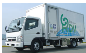
シュレッダー機搭載の車