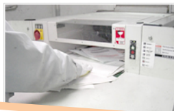
お客様の目の前で裁