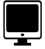
オフィス機器・備品