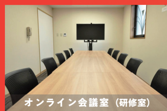
オンライン会議室 (研修室)