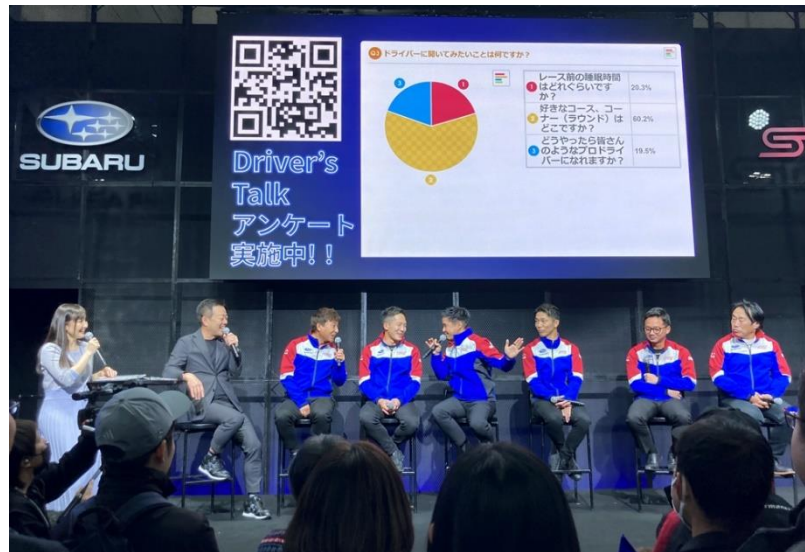
東京オートサロン 2026 SUBARU/STI ブース での respon ご利用風景

イベントの目的に応じた柔軟な運用が可能です。EDIX 東京では、豊富な活用事例とともに最適な導入方法をご提案します。