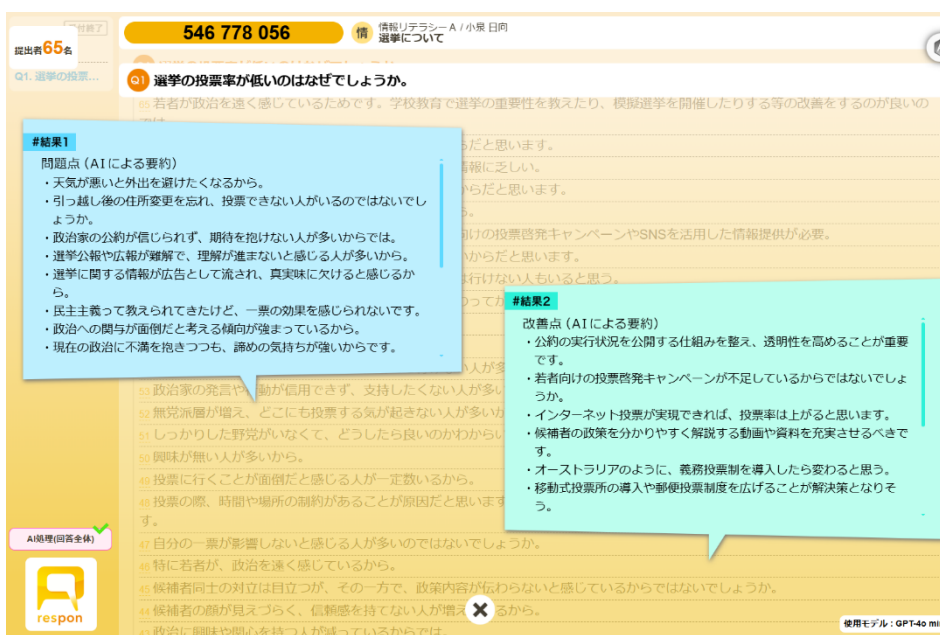
本格稼働が始まった respon LIVE-AI。教室で受講生の自由記入を分析します

「教育機関向け respon」は、学校・学部単位のエンタープライズプランに加え、教員単位で利用できる 教員向けプラン も提供しており、幅広い教育現場で活用が広がっています。