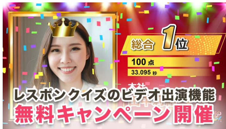
レスポクイズサービスの「ビデオ出演機能」無料キャンペーンを開催

新年会やキックオフ、入社式など、参加型イベントが増えるこの時期に、早押しクイズとビデオ出演を組み合わせることで、会場全体の一体感をより高めたイベント演出が可能になります。