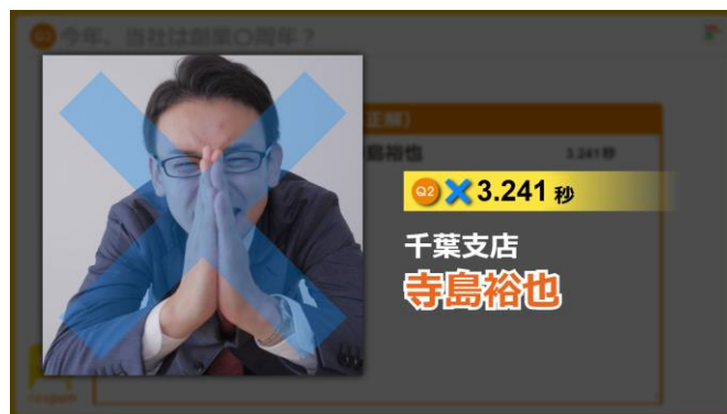
クイズを間違えた人がビデオ出演しているときには ×（バツ）マークが付きます

オンライン・ハイブリッドイベントはもちろん、リアルイベントにおいても、 大スクリーンに自身の姿が映し出される体験 は、参加者にとって印象的なものになります。