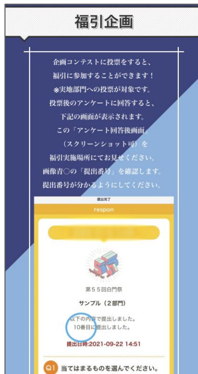
中央大学 白門祭での福引企画の案内（白門祭ホームページより）