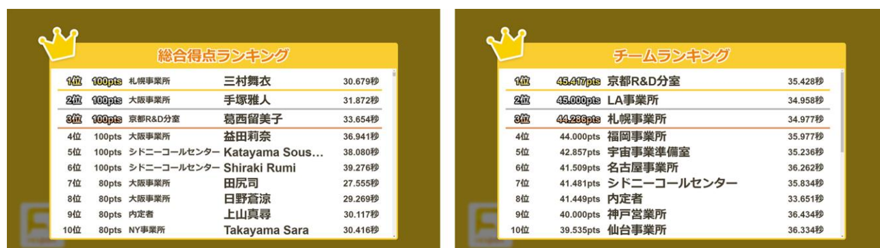
レスポんクイズの総合得点ランキング（左）と、新たに登場するチームランキング画面（右）

参加者が自己チームのランキングを上げるには、最後までクイズに解答し、なるべく多くの正解を速く送ることが唯一の攻略方法。「 チームバトル 」を導入することで、イベント参加者の解答意欲を最後まで持続させるとともに、「仲間と一緒に参加している」という参加者同士の一体感も生まれます。