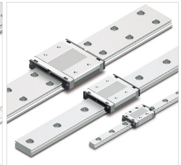
高温用タイプ RSX9, 12, 15

THKは独自の新製品開発を通して、小型電子部品の関連装置から小型の一般産業用機械まで、幅広いユーザーのニーズにお応えします。