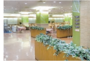
食堂 :環境デザイン・視認性向上の為のサイン計画・カラー計画を実施