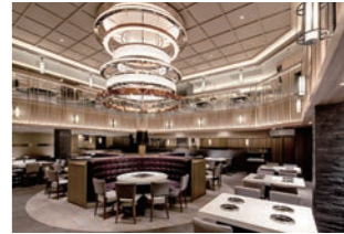
火鍋店 :食材をより美味しく見えるように照明計画・施工