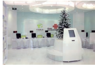
携帯販売店 :デザイン・設計・施工