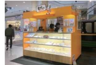
金券販売店 :展開立地を選ばない可動式販売ブース。SC内向け業態