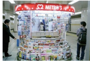
地下鉄販売店 :民営化に伴い商材・機能・全体のデザインの見直しを実施