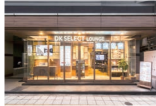
土地活用相談窓口 :需要喚起の為の戦略路面店舗。デザイン〜施工を実施