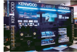
カーオーディオ什器 :ブランド訴求を目的に什器構成のデザイン設計