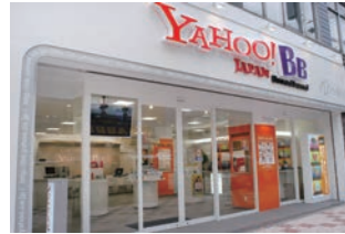
ネットサービス店 :ブランドイメージ確立の為の企画、意匠設計