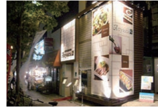
飲食店 :ファサード改装に伴う視認性強化、設計・施工