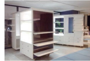
可動式販売店 :4t車載可能設計・製作