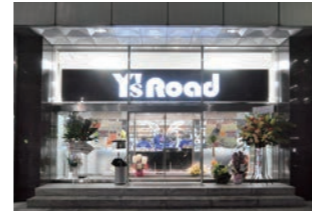
スポーツ自転車専門店 :200坪のデザイン〜施工。プランから引渡1ヶ月半