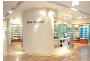
まくらメーカー新業態 :機能商品の販売オペレーション効率化を実現