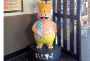
FRP人形 :店頭FRPの設計、製作・子供向け認知促進