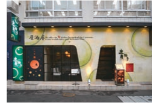
居酒屋 :老朽化に伴い女性客を意識したファサードデザイン・設計・施工