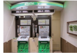
銀行ATM :既存店リニューアルのデザイン・照明計画・設計・施工