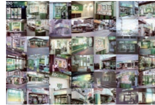
携帯販売店 :ブランド変更のサイン施工・什器量産・短期間出店の仕組構築