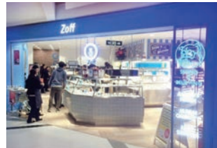
メガネ店 :新デザインに伴う設計・施工