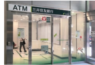
銀行支店 :改装に伴うサッシ、自動ドア、内装施工