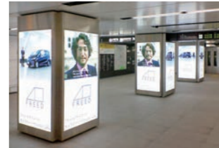
駅コンコースサイン :スペースを最大限に活用したサイン設計施工