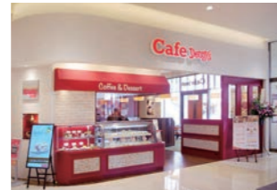
カフェ :新業態開発。店舗デザイン・サイン計画・入札管理まで総合監理