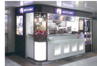
靴修理専門店 :立地特性に合わせたセカンドデザイン・企画・設計