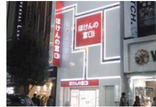
ほけん販売店 :立地特性に合わせた外装デザイン・設計・施工