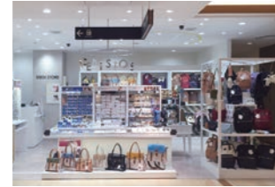
アクセサリーショップ :ブランドイメージ刷新の為のデザイン〜施工を実施