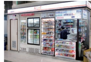
駅売店 :改札内外に向けた接客対応。設計・施工