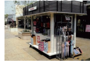
可動式販売店 :屋外用販売店。工場製作、トレーラー運搬可能な設計