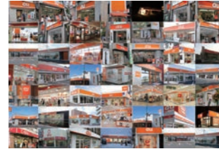
携帯販売店 :ブランド変更時、関東約400店の4週間リニューアル実施