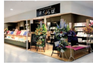
オーダーまくら寝具物販店 :VMDを考慮し陳列棚の配置、店舗レイアウト。SC内店舗施工