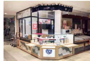
だんご販売店 :新業態デザイン。組み立て式間仕切りシステムで短工期化