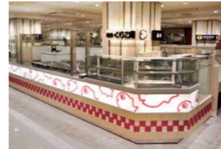
たい焼き販売店 :製造する姿と商品を演出するデザイン設計・システム什器