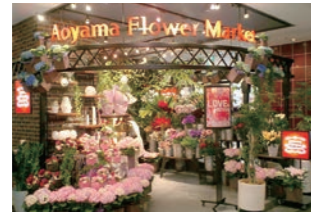
生花店 :多店舗展開に向けた本社内業務の改善提案、マニュアル制作