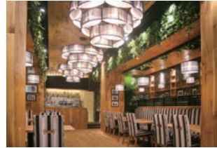
カフェレストラン :店舗活性化・メニュー見直しに伴い環境デザイン変更