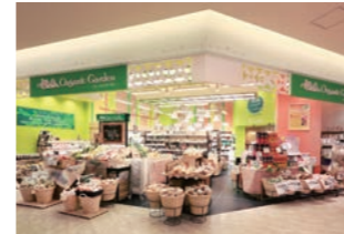
オーガニック食材販売店 :店頭活性化と居抜環境に合わせたローコスト設計