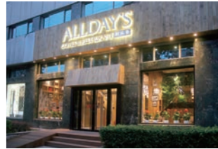
カフェレストラン :ファミリーレストランからカフェ・レストランへ