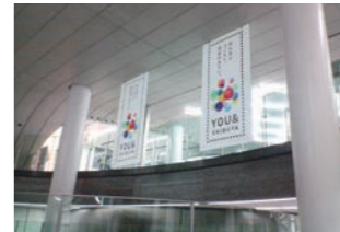
駅広告 :電車発着頭上の広告バナー。風圧計算、自動天井収納システム設置