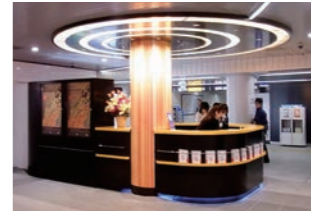
インフォメーションカウンター :駅構内という立地を考慮したデザイン設計