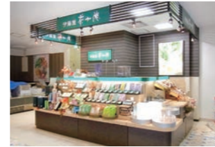
お茶販売店 :百貨店内。スペースを最大限に活用したデザイン設計