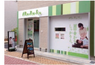
リラクゼーション店 :店頭訴求・視認性を考慮した内装設計・サイン・施工