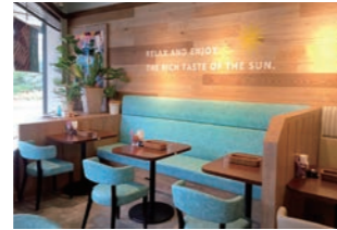
ハンバーグ店 :新ブランドレストラン1号店。デザイン・設計・監理を実施