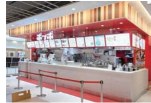
フードコートファストフード店 :デザイン・設計・監理を実施