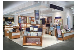
和小物店 :商材配置の変更に対応した機能要望をベースにデザイン・設計