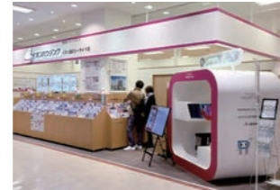
不動産 :SC、路面店など多店舗出店。本部指定の設計担当。施工