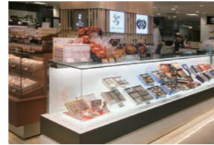
洋菓子販売店 :4メートルのガラスケースを一体物で製作