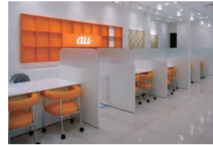
携帯販売店 :多店舗対応に設計・施工のシステム化を実現