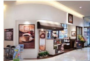
カフェ :上記店舗のブランド変更に伴う改装。デザイン・サイン計画・施工