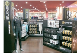
機能ウェアメーカー :ブランド訴求を目的に什器構成のデザイン設計