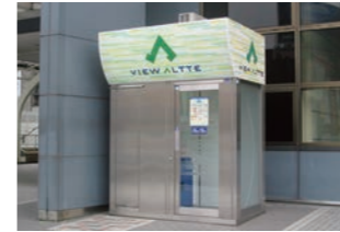
ATMブース :屋外仕様設計・移設可能な機能設計