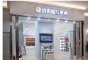
コンタクト販売店 :中国SC内出店の設計・施工