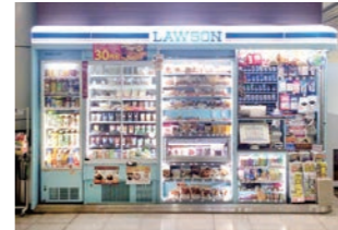
地下鉄売店 :ブース設計・施工。終電〜始発内、短時間施工