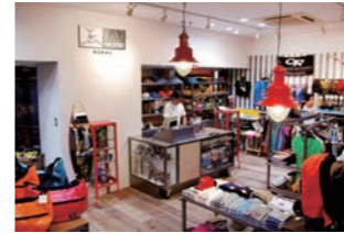
アウトドア店 :店舗全てにリサイクル素材を活用したデザイン設計