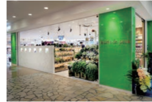
化粧品専門店 :品揃え重視により扱いブランド数を強調。SC内の設計・施工