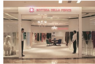
スカーフ販売店 :商品を最大限に活かしたデザイン・設計・施工