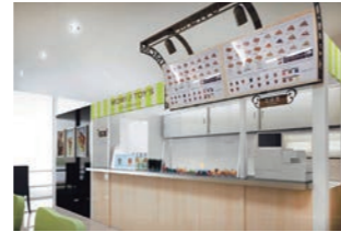
クレープ店 :水廻りの工期短縮、本体移設可能。ブース型組立て式店舗