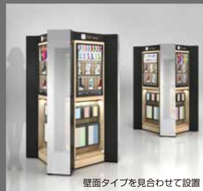
壁面タイプを見合わせて設置