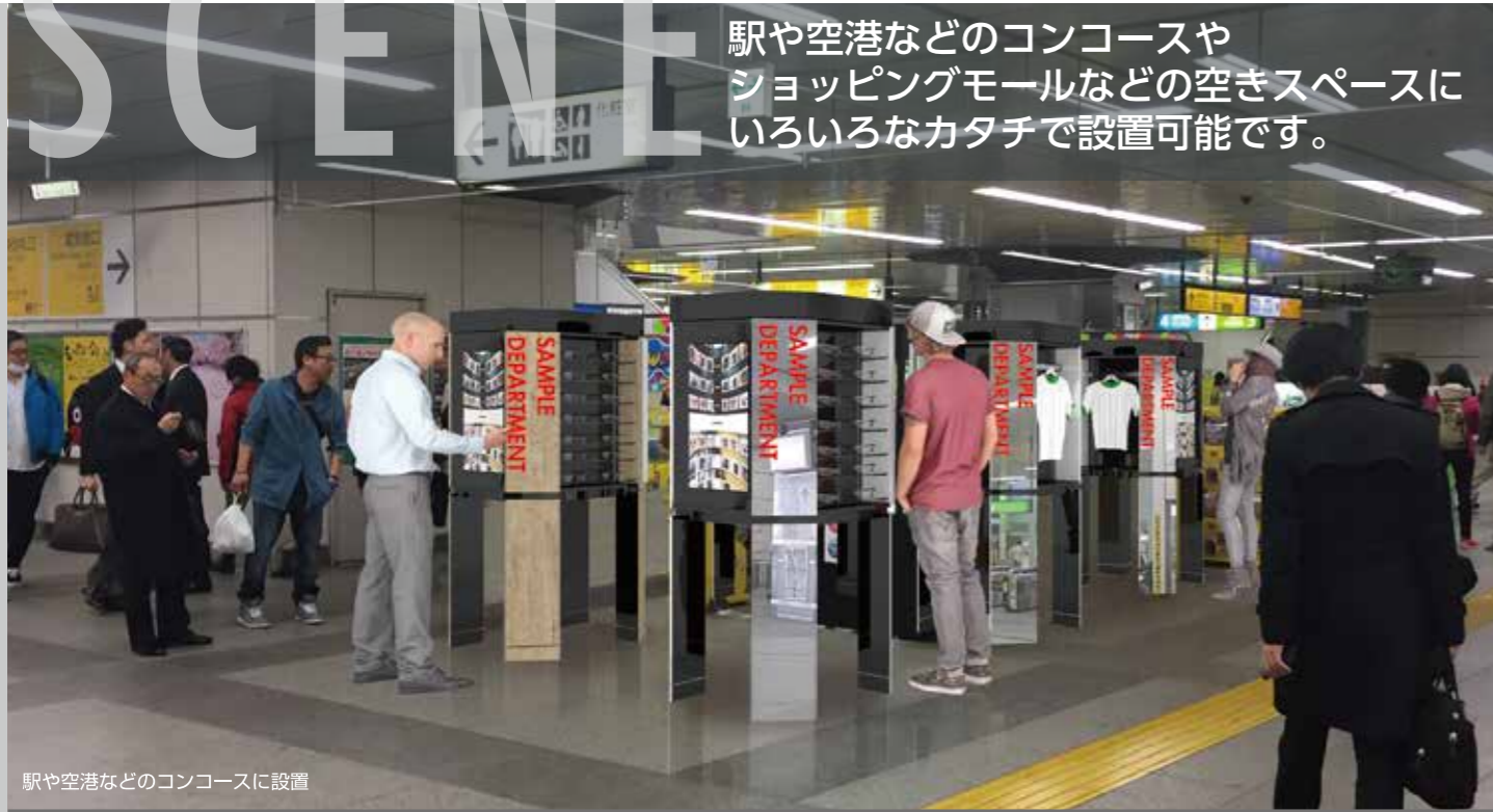
駅や空港などのコンコースに設置

駅や空港などのコンコースや ショッピングモールなどの空きスペースに いろいろなカタチで設置可能です。