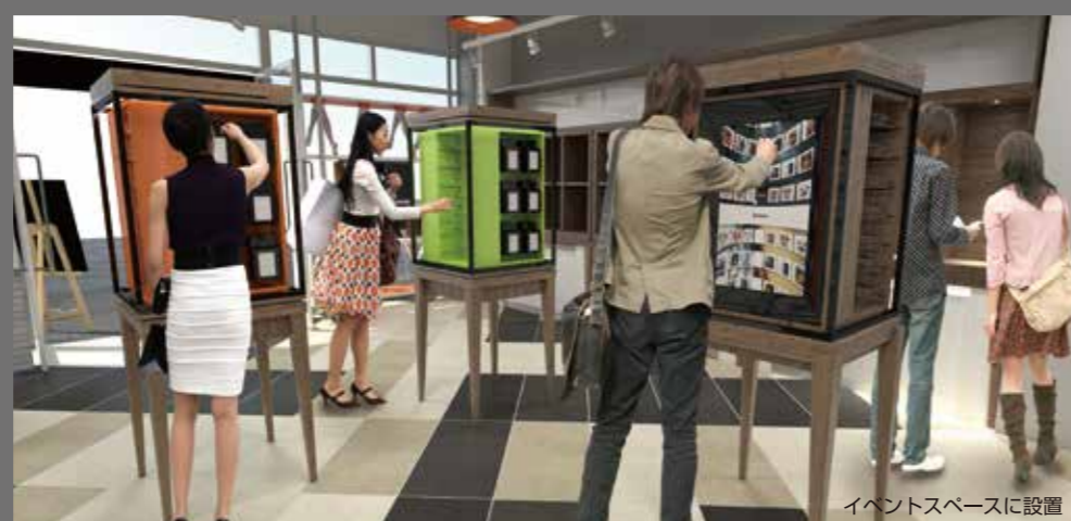
イベントスペースに設置