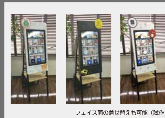
フェイス面の着せ替えも可能（試作）