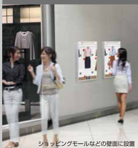
ショッピングモールなどの壁面に設置