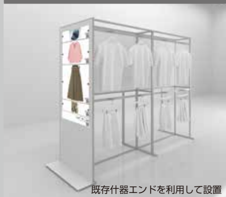
既存什器エンドを利用して設置