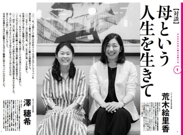
元サッカー日本女子代表 澤穂希さん × バレーボール全日本女子代表 荒木絵里香さん