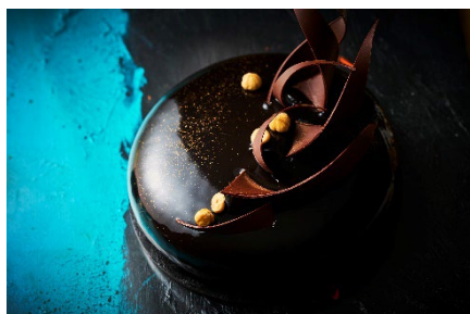
・強いままでいたいの