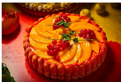
・僕のこと好きでしょ？