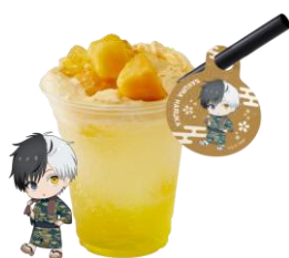
フローズンマンゴーソーダ