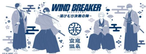
スペシャル手ぬぐい ～等身大キャラクター～