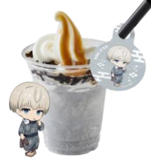
黒ごま塩キャラメルコーヒーシェイク