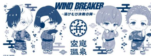
スペシャル手ぬぐい ～ミニキャラクター～