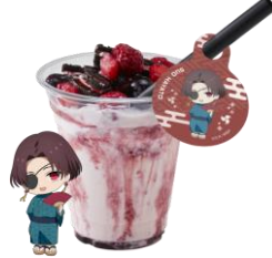
ベリーベリーシェイク