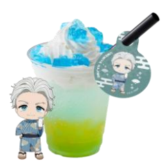
ライチヨーグルトソーダ