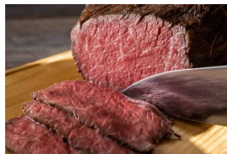
シェフ特製ローストビーフ