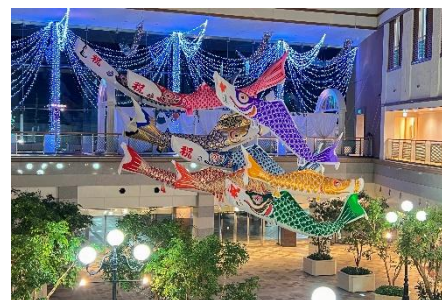
イルミネーションとともに幻想的な夜の空間