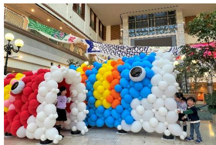
くぐって楽しめる鯉のぼりトンネル

【お問い合わせ】TEL：0299-95-5511（代表） 公式ウェブサイト： https://art-kashima-central.com/