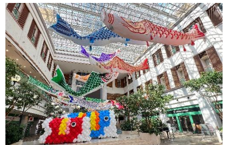
空中を泳ぐように広がる鯉のぼりの演出

展示作業を終え、スタッフが片付けをしていた夜、温泉帰りに館内着姿のご家族がモール広場に立ち寄りました。天井いっぱいに泳ぐ鯉のぼりとカラフルなバルーントンネルを見つけると、よちよち歩きの子が「あー！あー！」と声を上げながら駆け寄り、夢中で見上げる姿も見られました。「すごいね」「初めて来たけれど見られてよかったね」と笑顔を見せるご家族の姿が印象的でした。バルーントンネルもくぐりたそうにしていたが、夜も遅かったため「明日また来ようね」と話しながらその場を後に。館内展示ならではの、宿泊客が夜に出会う思いがけない楽しみとしてもご好評をいただいています。