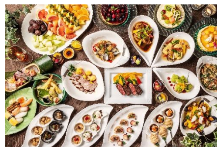
ビュッフェ料理イメージ