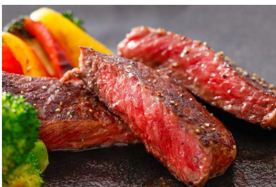
メニュー一例：甲州ワインビーフステーキ