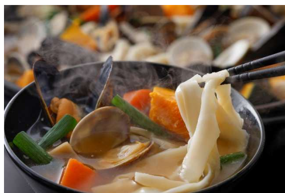
メニュー一例：魚介ほうとう鍋