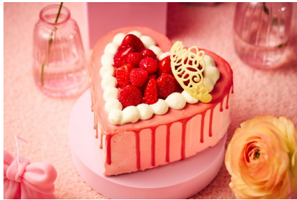
・かわいいでしょ？