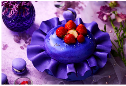
・君はもう僕のものだよ