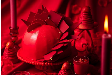
・俺が叶えてやる