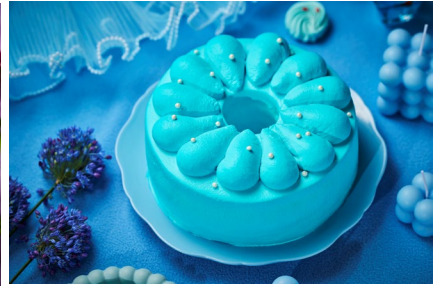
・君しか見えない