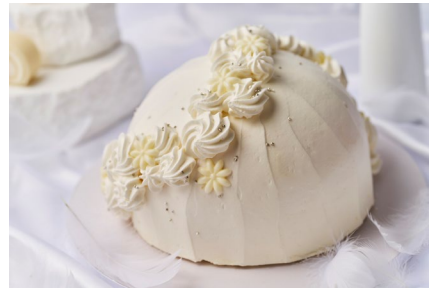
・忘れられないよ