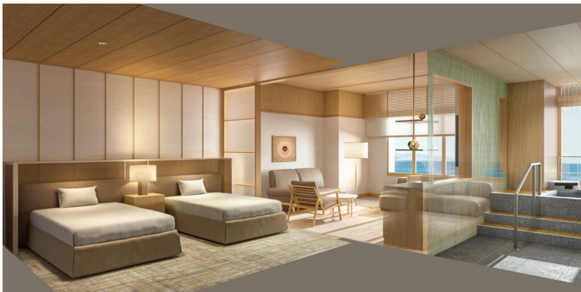
窓の外に熱海湾を望む絶好のロケーションを独り占めできる、77 m 2 の開放的な露天風呂付客室を新設

亀の井ホテル 熱海 別館（所在地：静岡県熱海市、総支配人：中村岳志、以下当ホテル）は、「別邸」をコンセプトに館内改装を行い、2026 年 3 月 30 日（月）にリニューアルオープンいたします。3 月 20 日（金）に一部客室を先行オープン。熱海の自然と調和した、より落ち着きと開放感のある滞在空間へ変わります。なお、先行オープン対象客室を含む宿泊予約は、2025 年 12 月 19 日（金）より開始いたします。