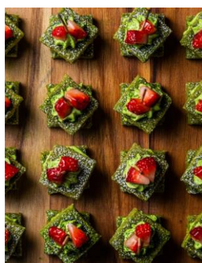
抹茶のフィナンシェ