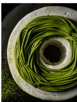
抹茶のシフォンケーキ