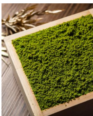
抹茶のティラミス