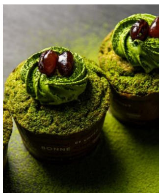
抹茶のカップケーキ