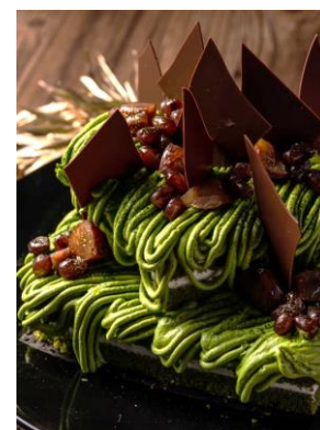
抹茶のモンブラン