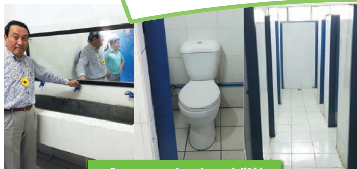
Corazon Aquino 小学校