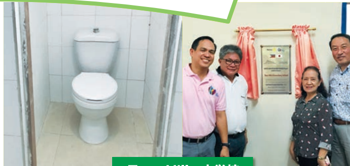
Toro Hills 小学校