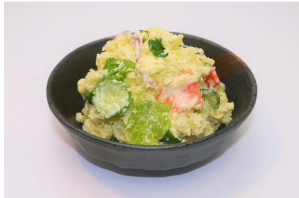
6品目の野菜が摂れるポテトサラダ