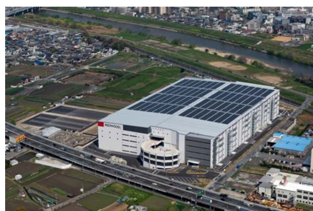
レッドウッド藤井寺ディストリビューションセンター