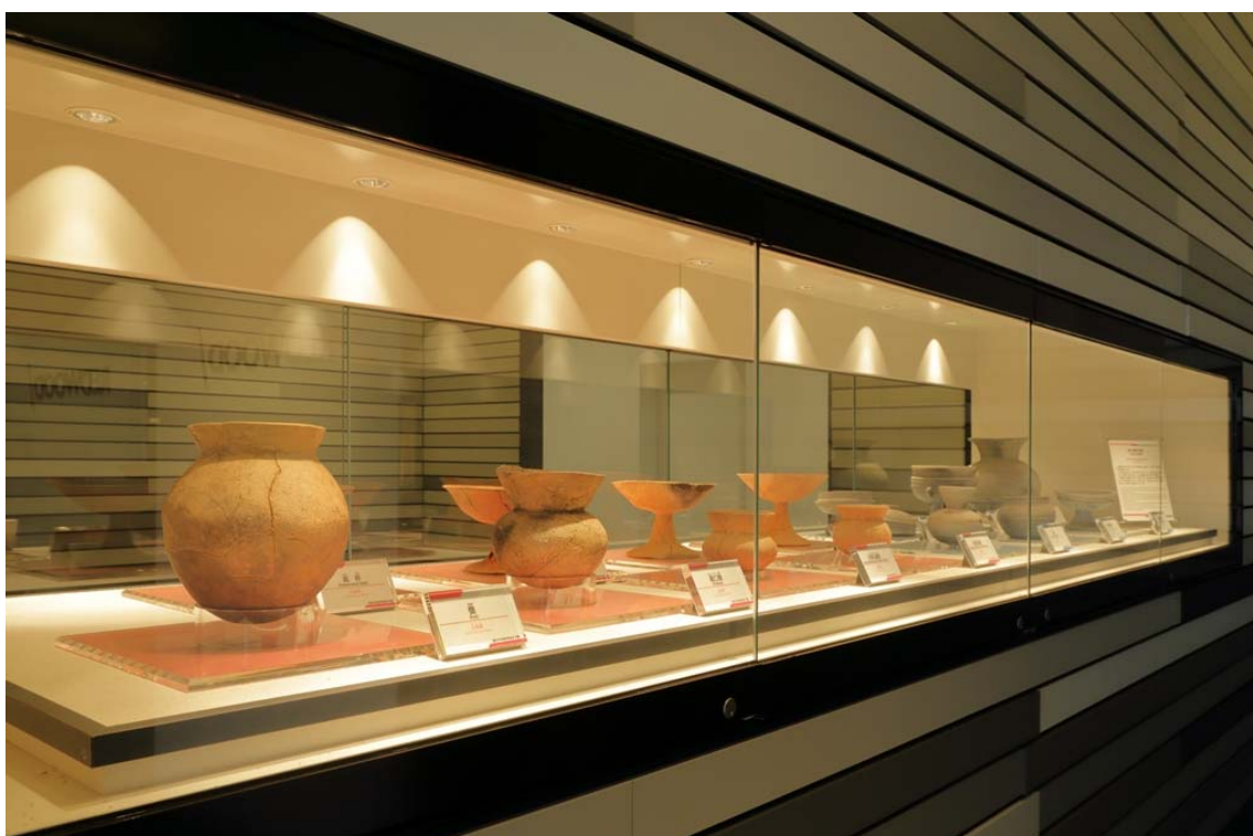
「津堂遺跡」紹介・展示スペースの土器の展示

ESR 株式会社（代表取締役：スチュアート・ギブソン、本社：東京都港区虎ノ門、以下 ESR）は レッドウッド藤井寺ディストリビューションセンター（以下、藤井寺 DC）の所在地にある 「百舌鳥・古市古墳群」の世界文化遺産登録決定を記念して、 施設内の「津堂遺跡」紹介・展示スペースを 7 月 22 日から期間限定で一般公開いたします。