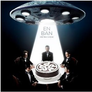
「以心電信」収録 コラボベストアルバム「縁盤」