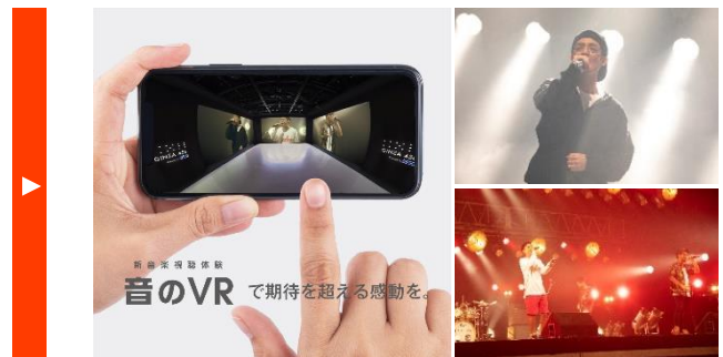
2021年 「新音楽視聴体験 音のVR」