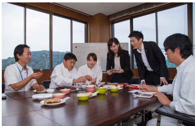
『クリームシチューに合うチーズマンハッタン』 開発会議の様子

もちろん弊社ハウス食品で作ってみることも考えたのですが、そこはパンのプロであるパンメーカーさんと一緒に「本気で」開発したいという想いから、以前よりお取引があり、両社の距離が近かったリョーユーパンさんにご相談させていただきました。試行錯誤の末、九州のソウルフード「マンハッタン」で、クリームシチューに合うパンの開発が実現しました。みなさまには是非、寒い冬はお鍋じゃなくて、クリームシチューとチーズマンハッタンを一緒にご家庭で食べて、この意外な食べ合わせに驚いてもらえるとうれしいです。