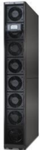
Uniflair InRow DX 300mm

「Uniflair InRow Cooling」シリーズは、データセンターやエッジのサーバーームのポッド、IT ラック列内に組み込み、高発熱サーバーの冷却を行う局所冷却ソリューションです。今回発売する「Uniflair InRow DX 300mm」は、冷却に水を使わない空冷方式を採用しています。チラー（冷却水循環装置）や水配管設備がない建物でも高発熱エリアへの対策として増設が可能です。また、筐体および室外機の省スペース化により、より多くの IT 機器の設置スペースが確保できます。コンパクトなのにパワフルでエネルギー効率に優れた設計となっているため、中小規模のデータセンターや企業内のサーバーームなどオンプレミスの高密度エッジ環境に最適です。