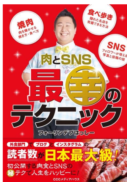
肉とSNS 最幸のテクニック (CCCメディアハウス)