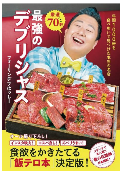
厳選70軒 最強のデブリシャス (ワニブックス)

SNS時代のグルメユニット「食べあるキング」では、所属メンバーとして多方面で活躍するグルメエンターテイナー「フォーリンデブはっしー」が、2019年2月22日（金）に新刊書籍を2冊同時に発売いたします。前作から4年半ぶりとなる、フォーリンデブはっしー自身のすべての知見や経験談を盛り込んだ、人生の集大成となる渾身の力作です。