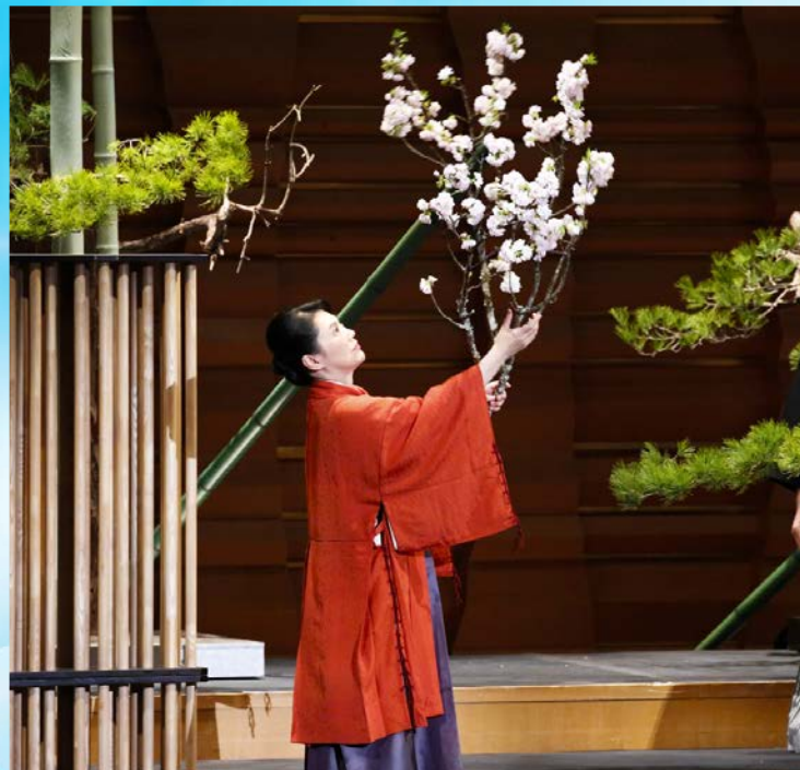
いけばな：池坊専好