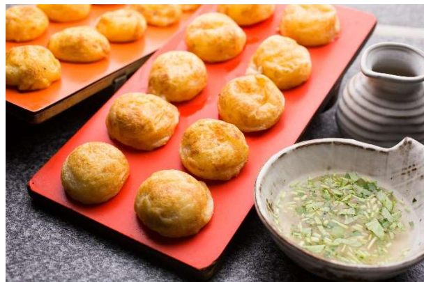
明石市のご当地グルメ「あかし玉子焼」