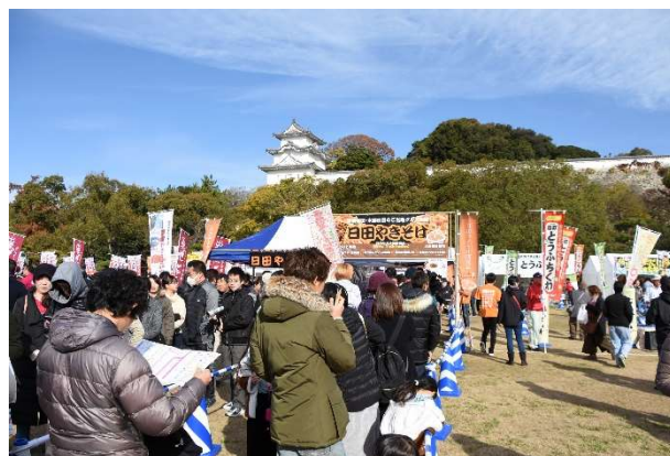
『2017西日本B-1グランプリin明石』（2017年11月、明石公園）の会場風景

<本件に関するお問い合わせ先> 一般社団法人 明石観光協会 観光プロモーション課 担当：木村 明石市東仲ノ町6-1 アスピア明石北館7階（〒673-0886） TEL.078-918-5080 FAX.078-911-0579 E-mail : info@yokoso-akashi.jp URL: http://www.yokoso-akashi.jp