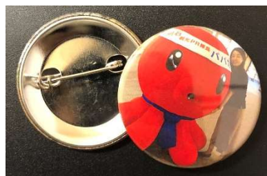
オリジナル缶バッジ