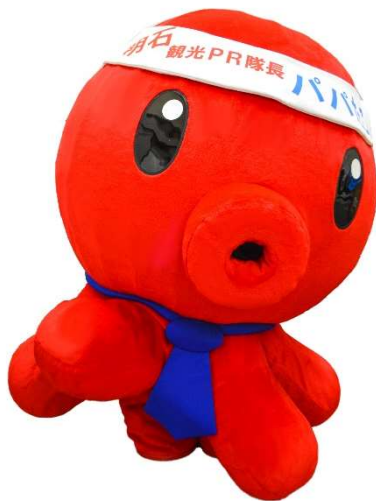
明石観光PR隊長 パパたこ

【URL】 http://gotouchi-chara.jp/hikone2018/