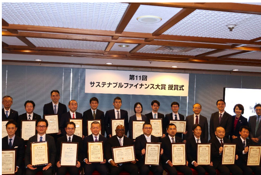
< 授賞式の様子 >