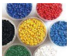
再生プラスチック等