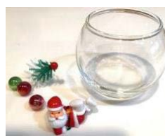
クリスマスワークショップ (参考イメージ)