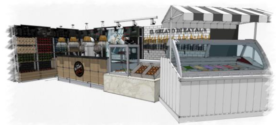
Vergnano のコーヒーやジェラートが味わえるバル

※日曜・連休最終日の祝日 : 7:00-22:00 (レストラン 11:00-22:00)