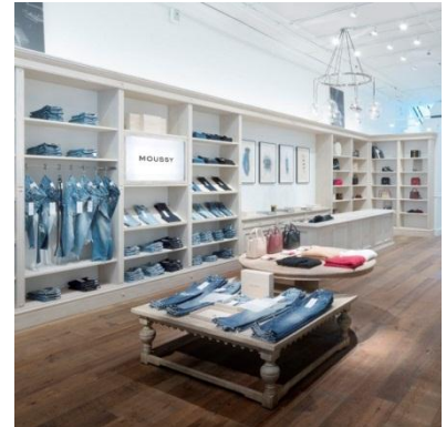
↑ N.Y. MOUSSY SOHO 店

2016年4月には、北米地区における販売子会社として BAROQUE USA LIMITED を設立し、9月に北米 N.Y.マンハッタン地区に「MOUSSY」と「ENFÖLD」を出店いたしました。テストマーケティング、ブランドコンセプトを検証しつつ、当社が日本で成功した SNS を活用したファンコミュニティ作りを通してブランドの認知向上を図っています。