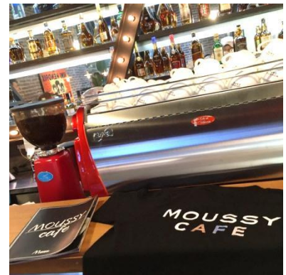
↑ SHEL'TTER 上海大悦城「MOUSSY CAFE」

2017年7月現在、中国で展開しているブランドは「MOUSSY」、「SLY」、そして複合業態として自社セレクトショップ「SHEL'TTER (シェルター)」があります。お客様からのご支持をいただき、出店の勢いはさらに加速しています。