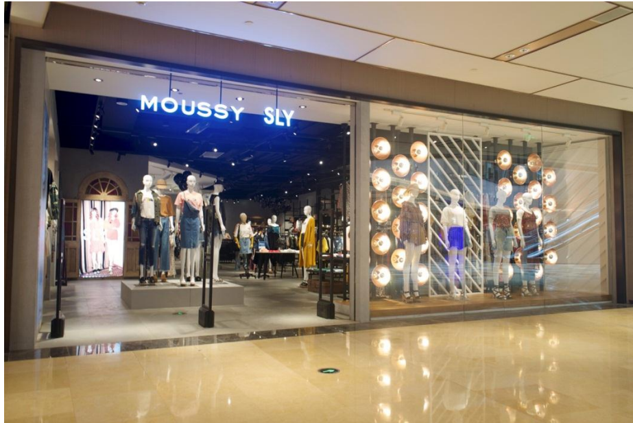
↑興業太古匯 MOUSSY & SLY 総合店