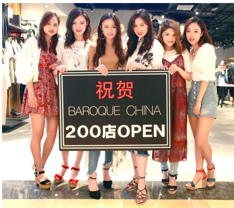
↑ 200 店舗達成を祝う、興業太古匯 MOUSSY & SLY 総合店 上海スタッフ