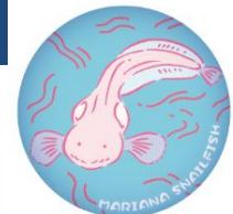
マリナスネイルフィッシュの缶バッジ 270円（税抜）