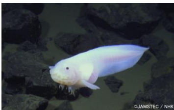
マリナスネイルフィッシュとよばれるシンカイクサウオの仲間。水深8000メートル超の深海を、白いひれをゆらめかせて泳ぐ姿(=写真右)は、深海研究者に驚きを与えた。

これまで生きた魚の最深映像記録は8,152mでしたが、今回の映像はマリアナ海溝8,178mで撮影に成功したものとなります。4K高精細映像で、その瞬間をとらえた深海調査機器「フルデプスミランダ」の実機（現在展示中）とともに展示します。