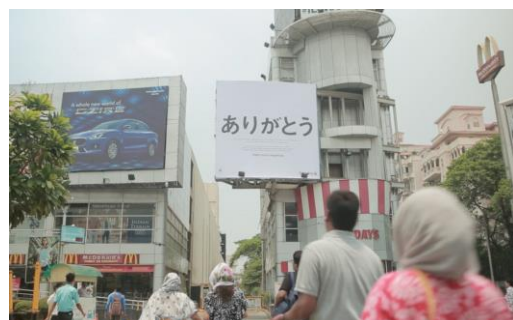
【インド・デリーに掲示された巨大看板広告】