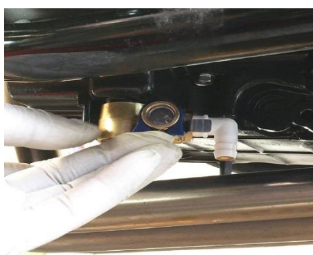
固定レバークリップ付