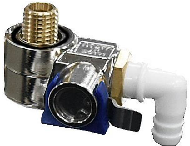
車体に馴染む プレミアム版 商品画像