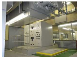
老朽施設更新工事・施設再構築工事