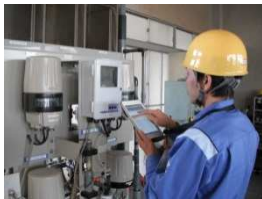
浄水場及び関連施設管理業務