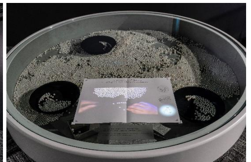
ジュエリーデザイナーやクラフツマンの手しごとの場を再現したコーナー