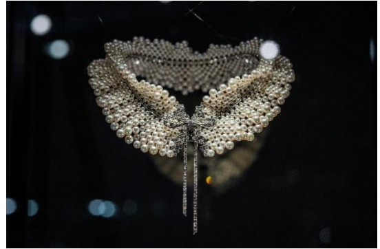
熟練したクラフツマンによって制作されたハイジュエリー