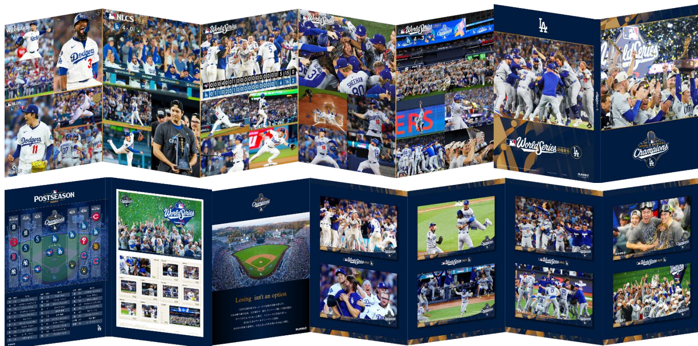
プレミアムホルダーの中に「フレーム切手」と 「大型ポストカード」を収納してお届けします。

試合結果や選手情報を掲載予定 大谷翔平選手、山本由伸選手、佐々木朗希選手の 躍動する姿をはじめ、 主力選手たちの名場面をふんだんに収録。 勝利の瞬間、歓喜の笑顔、そしてあの興奮が、 プレミアムホルダーを広げるたび、よみがえります。