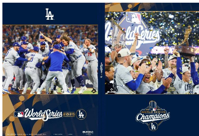
(メタリック調の輝きが特徴のゴールドフォイル仕様) ▲プレミアムホルダー×1個