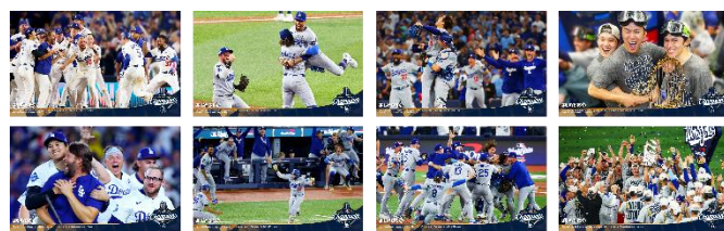
(メタリック調の輝きが特徴のゴールドフォイル仕様) ▲大型ポストカード×8枚 (計8種) サイズ (約) : 縦100×横163mm

試合結果や選手情報を掲載予定 大谷翔平選手、山本由伸選手、佐々木朗希選手の 躍動する姿をはじめ、 主力選手たちの名場面をふんだんに収録。 勝利の瞬間、歓喜の笑顔、そしてあの興奮が、 プレミアムホルダーを広げるたび、よみがえります。