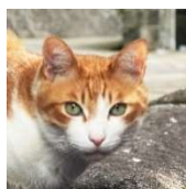
猫山雅治 (CV: 福山雅治)