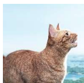
高田にゃきら (CV: 高田明)