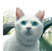
役所猫司郎 (CV: 役所広司)