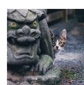
にゃん川清 (CV: 前川清)