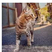
にゃが濱ねる (CV: 長濱ねる)