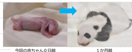
今回の赤ちゃん0日齢