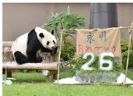
26歳誕生会のシーン