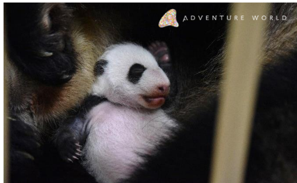
母親に抱かれる赤ちゃん 9月14日撮影

アドベンチャーワールド（和歌山県白浜町）で、2018年8月14日（火）に誕生したジャイアントパンダの赤ちゃん（メス）が、生後1か月（31日齢）を迎えました。