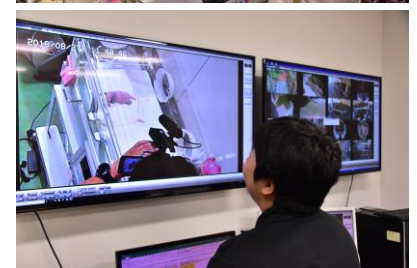
写真：赤ちゃんの様子を見守るスタッフ