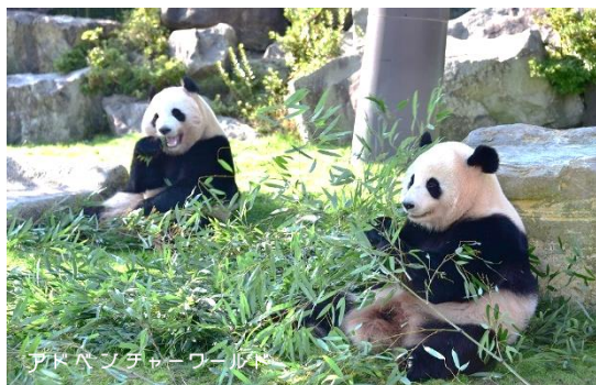
3歳のふたご「桜浜・桃浜」

アドベンチャーワールド（和歌山県白浜町）では、7月6日（金）、7日（土）にジャイアントパンダの子供たち「桜浜（おうひん）・桃浜（とうひん）」と「結浜（ゆいひん）」の七夕イベントを開催いたします。子供たち3頭のこれからの健やかな成長に願いを込めて、短冊に見立てたニンジンの笹飾りを用意し、3歳のふたご「桜浜・桃浜」には幅50cmの星形の氷をそれぞれプレゼントし、1歳の「結浜」には特製の大きなかき氷をプレゼントします。