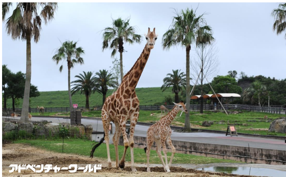
サバンナエリアでの公開練習風景 平成 29 年 7 月 3 日撮影

平成 29 年 7 月 13 日 (木) アミメキリンの赤ちゃんが母親と一緒にサファリワールドのサバンナエリアにデビューします！アミメキリンの赤ちゃんは平成 29 年 6 月 6 日 (火) に生まれ、これまで他の動物と接触しない囲われたエリア内で母親と一緒に暮らしてきました。赤ちゃんの順調な成長に伴い、シマウマやダチョウ、そして家族や仲間のアミメキリンたちが暮らしているサバンナエリアへデビューすることが決まりました。