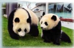
新たな出会いと感動空間 パンダファミリーに感動の大接近！