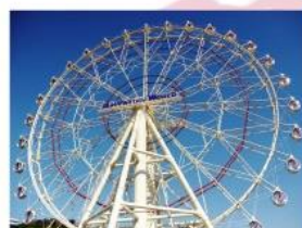
オーシャンビューホイール