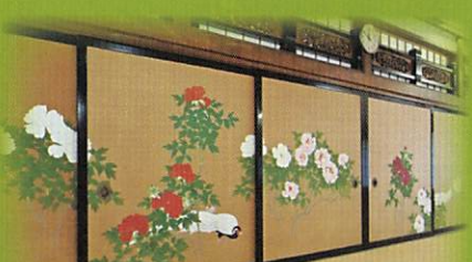
日展画家 山口玲照(やまぐちれいしょう)作

今いただく食事は、心身ともに 健やかに、仏の道を成ずるた め、ともに理念をもっていたた ります。