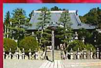
可睡齋本堂 初詣・初祈禱 1/1(元日)~1/31(水)