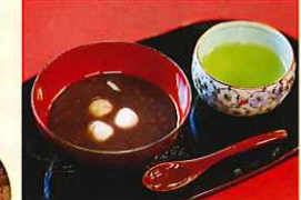
お茶スイーツ ※盛付け等はイメージです。 (煎茶・ぜんざいセット)(1月下旬~4月土予定)