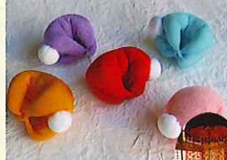
2,000体 さるぼぼ (1/1~4/3 期間中展示)