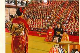
「きもの」で写真 (2/3, 3/3)