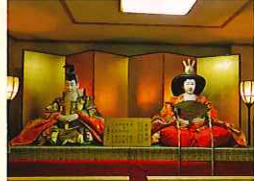
等身大のおひな様 (製作期間4年10ヶ月)(1/1~31)