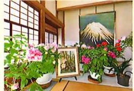
室内ぼたん園 (1/1~4/3 期間中開園)