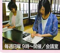
毎週日曜 9時~開催/会議室