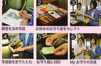
1 願意を決め写経 2 お好みのお守り袋をセレクト 3 4 写経紙を折りたたむ 5 お守り袋に封印 6 Myお守りの完成