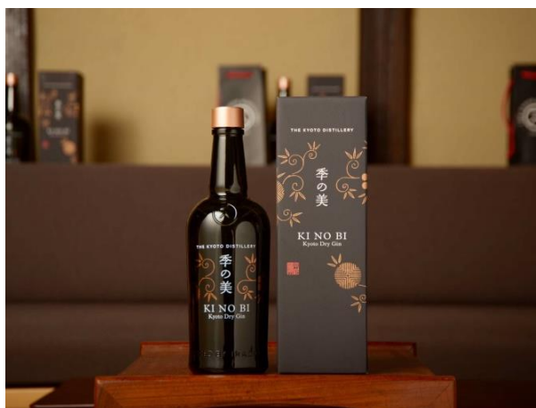
KIRA KARACHO（雲母唐長）が 文様監修した季の美のパッケージ