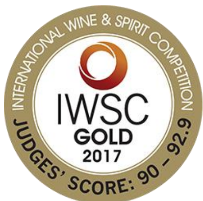
「コンテンポラリージン」 のカテゴリーで金賞受賞

2016年京都で初めてスピリッツの製造免許を取得した京都蒸溜所の「季の美」は、柚子や山椒を含む11種のボタニカルを使用したドライジンです。「シトラス」、「スパイス」など6つのエレメントに分けて蒸溜した後にブレンド（“混和”）する独特な手法を用いており、お米から作るライススピリッツと伏見の伏流水を使用しています。この度の受賞は京都の地の物を積極的に取り入れ、国産クラフトジンを牽引している「季の美」が世界でも認められた証です。